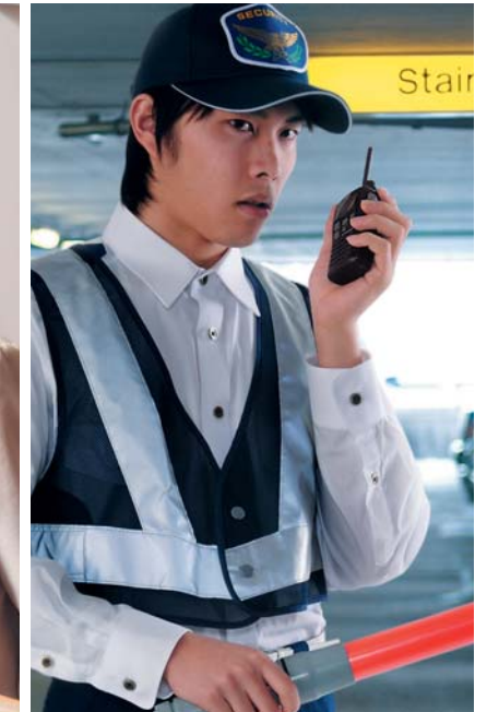
交通整理 交通状況をすばやく、確実に把握。 安全でスムーズな交通整理を実現します。