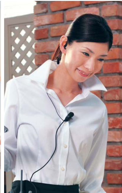
レストラン ホールと厨房間などの連絡を効率化。 注文にすばやく応じることができます。