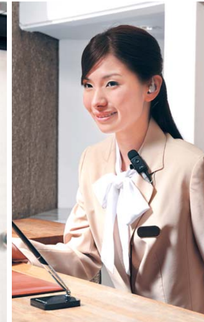
ホテル フロントとベルボーイなどの連携を強化。 効率的で行き届いたサービスを提供できます。