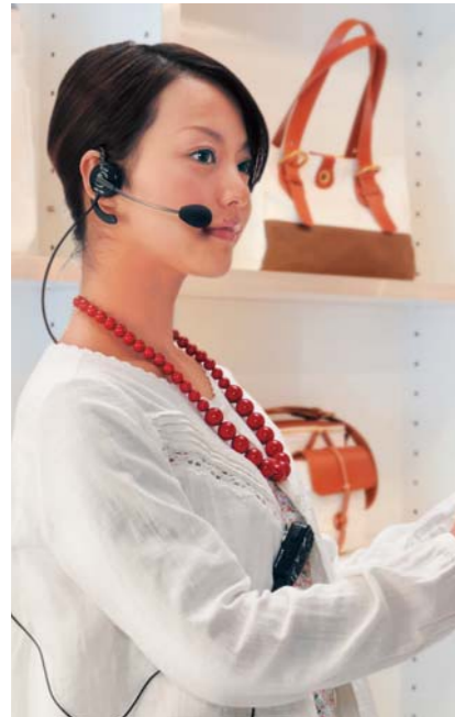
アパレル お客様の問い合わせに迅速に対応。 お店のイメージアップにつながります。