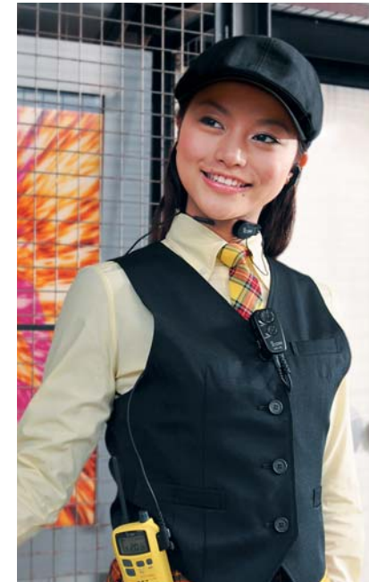
アミューズメント施設 お客様の誘導や、スタッフ間連絡の効率をアップ。 質の高いサービスを実現します。