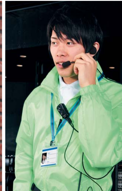
イベント会場 綿密なスタッフ間のコミュニケーションを実現。 円滑なイベント運営や安全確保につながります。