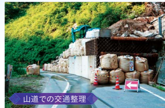
山道での交通整理

通話装置としてではなく、中継装置としても使えます。屋外における広範囲での通話や、見通しの悪い場所での通話をサポートします。