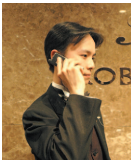
▲各セクションのスタッフが携帯端末で緊密に連携

また、ブライダル担当スタッフの方は、各携帯端末が固有にもつ050番の電話番号をお客様に伝えることで、社内のどこにいても待たせることなくダイレクトに電話を受けることができ、顧客満足度と信頼の向上につながっています。