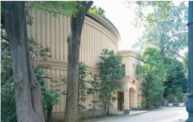
▲小高い丘に建つ「ロビンスクラブ」はCMやドラマのロケ地としても有名な洋館のレストラン